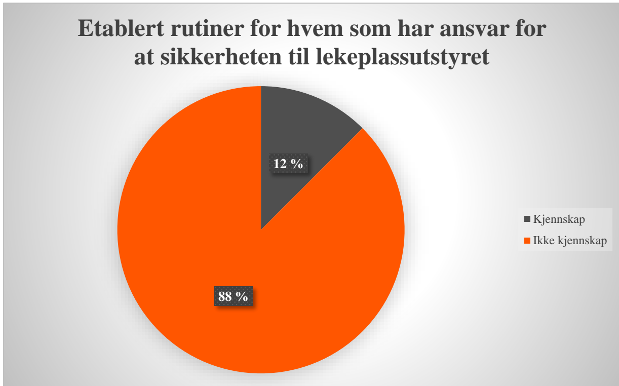
Figur 3. Registrere hendelser og iverksette tiltak slik at disse ikke gjentar seg.