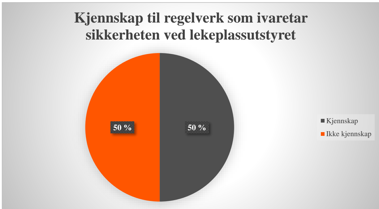
Figur 1. Kjennskap til regelverk.