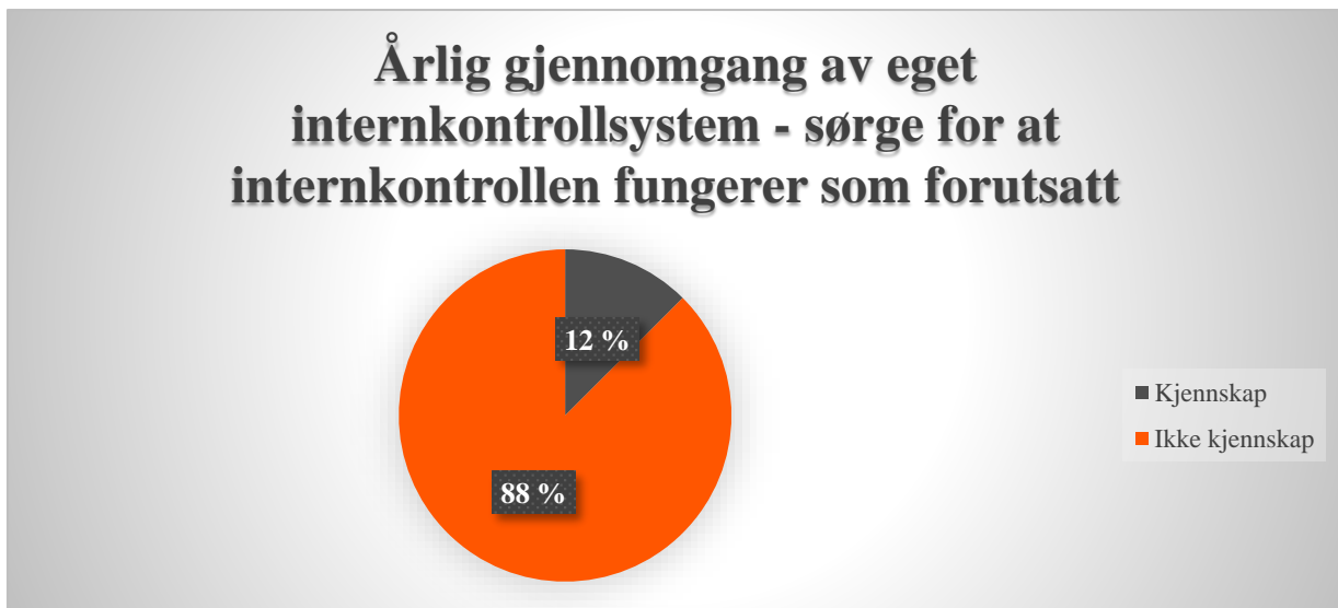
Figur 4. Årlig gjennomgang som kan identifisere eventuelle forbedringspunkter.